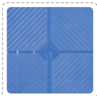
>> 全方位防滑丝纹理